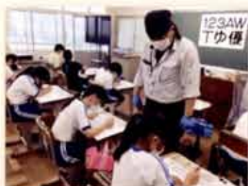
① 小学生の表札作り体験 （広告美術仕上げ職種）

「小中学校などの児童・生徒」や、「地域若者サポートステーションの支援対象となる方」へ、「ものづくりの魅力」を伝えます。体験することでものづくりへの興味を喚起し、マイスターの製作実演や講話で、マイスターの仕事や、体験した技能が仕事の中でどう活かされているかなどを学びます。