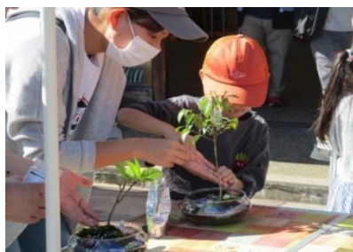
マイクロ盆栽づくり