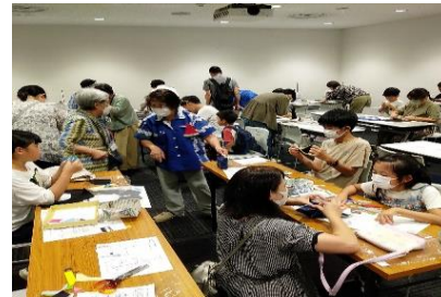
ペンギンカバー・ペンケースづくり