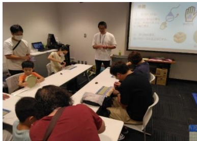
ミニ畳・コースターづくり