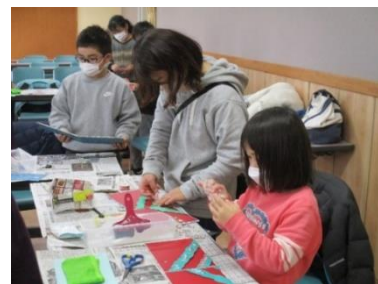
からくり蝶番づくり