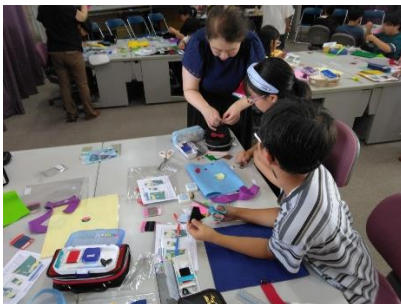
(ペンケースづくり)