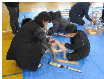
(子供用イスづくり)