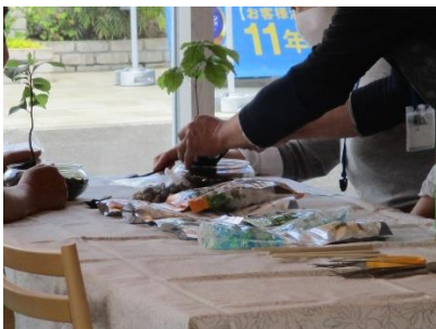
(ミニチュアガーデンづくり)