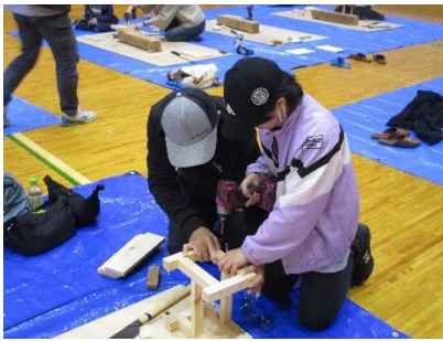
(子供用イスづくり)