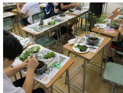
(ミニインテリアガーデンの作庭)