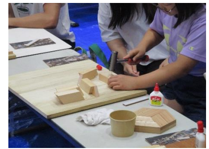
(木工パズルづくり)