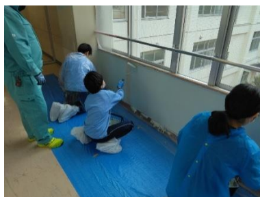
仙台市立茂庭台小学校