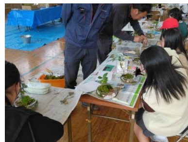
白石市立大平小学校