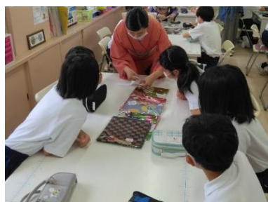
聖ドミニコ学院小学校