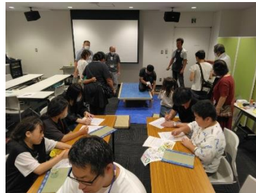
ミニ畳・コースターづくり