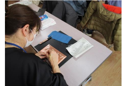
銅板レリーフ(表札)づくり