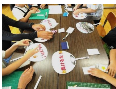
大崎市立古川西小中学校