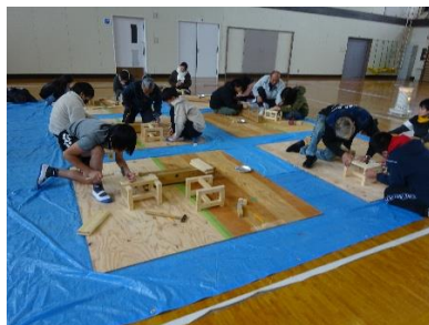
仙台市立岡田小学校