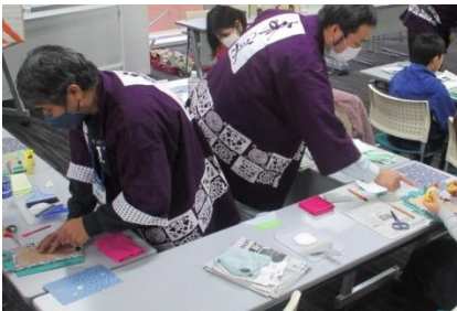
からくり丁番づくり