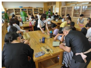
東松島市立矢本西小学校